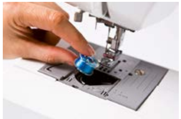
Einfach eine volle Spule einsetzen, schon sind Sie startbereit