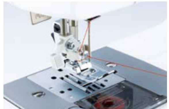
Einfaches automatisches Einfädeln