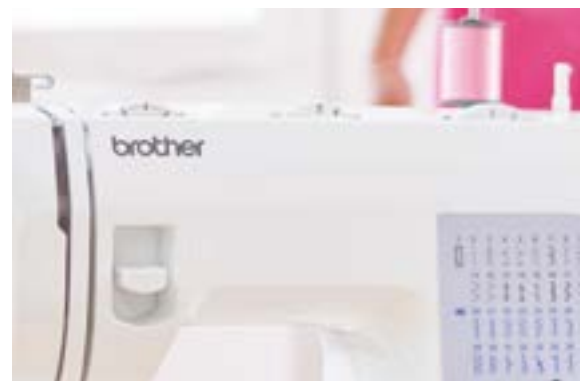
Stichlänge + Stichbreite einstellbar